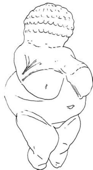
Desen al uneia dintre cele mai vechi figurine din Paleolitic descoperite pe teritoriul Europei (la Willendorf, în Austria Inferioară). Nu s-a putut stabili dacă statueta din calcar oolitic, datată 28 000–25 000 î. Hr., servea drept idol al fertilității sau drept obiect erotic.

Am spus despre factorii reali că sunt recurenți, fiindcă formele pe care poate să le îmbrace organizarea